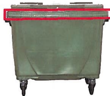
Système de prise européenne.