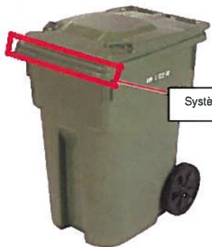
Système de prise européenne.