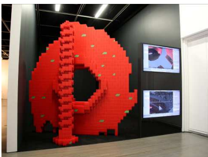
© Tom Watson, Crush and Burn .

Thèmes abordés lors des visites et ateliers de création: Les maquettes en trois-dimensions, la photographie et les espaces imaginés.