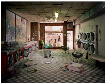
© Lori Nix, Laundromat , 2008

REGARDE ET APPRENDS! Tout au long de l'année scolaire, la Galerie d'art Stewart Hall offre gratuitement* aux élèves de niveau préscolaire, primaire et secondaire de Pointe-Claire des visites commentées de ses expositions. Conçues par des animateurs qualifiés, ces visites ont pour objectif de démystifier l'art et d'encourager le dialogue en explorant en profondeur le thème, la démarche artistique et les techniques employées, situant ainsi les œuvres dans un contexte plus large. De plus, chaque visite est suivie d'un atelier de création adapté au groupe d'âge.