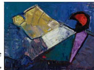
© Areg Elibekian, Composition , 2015, Photo : Guy L'Heureux

Chacun à sa façon, les trois artistes de cette exposition ne se contentent pas de reproduire en deux dimensions un espace à trois dimensions. Ils n'imitent pas, ils n'interprètent pas; ils créent des univers et déjouent le médium photographique, traditionnellement réputé pour sa fidélité à la réalité.