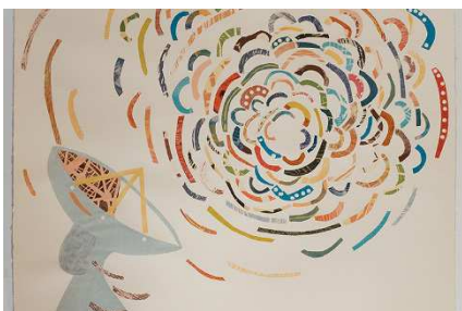
© Louise Boisvert, Blablabla , 2013.

Un satellite gravite autour de la terre, laissant sur son passage une poussière d'étoiles. Comme autant de semence de rêve et d'imaginaire, les œuvres de Louise Boisvert invitent à tourner le cœur vers le ciel et les yeux vers un monde infini des couleurs et des formes.