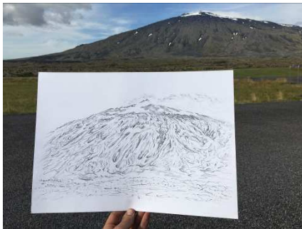
© Matt Shane, Pond Out Front , 2016