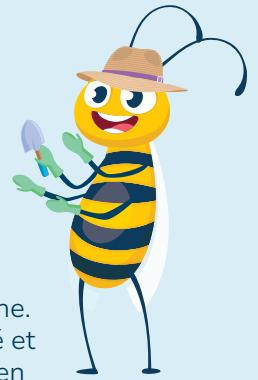
Eco-Nico, ambassadeur environnemental

Le gazon traditionnel apporte peu d'avantages environnementaux, puisqu'il ne représente qu'une seule espèce de plante non indigène. Il soutient mal la biodiversité et la qualité du sol. Son entretien demande souvent beaucoup d'eau et l'utilisation de produits chimiques.