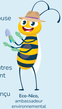
Eco-Nico, ambassadeur environnemental

Un jardin pré fleuri, au contraire, est conçu et entretenu de façon intentionnelle. Il utilise des plantes indigènes et imite les écosystèmes naturels afin de soutenir la biodiversité.