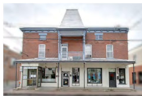
Boomtown avec ornements victoriennes