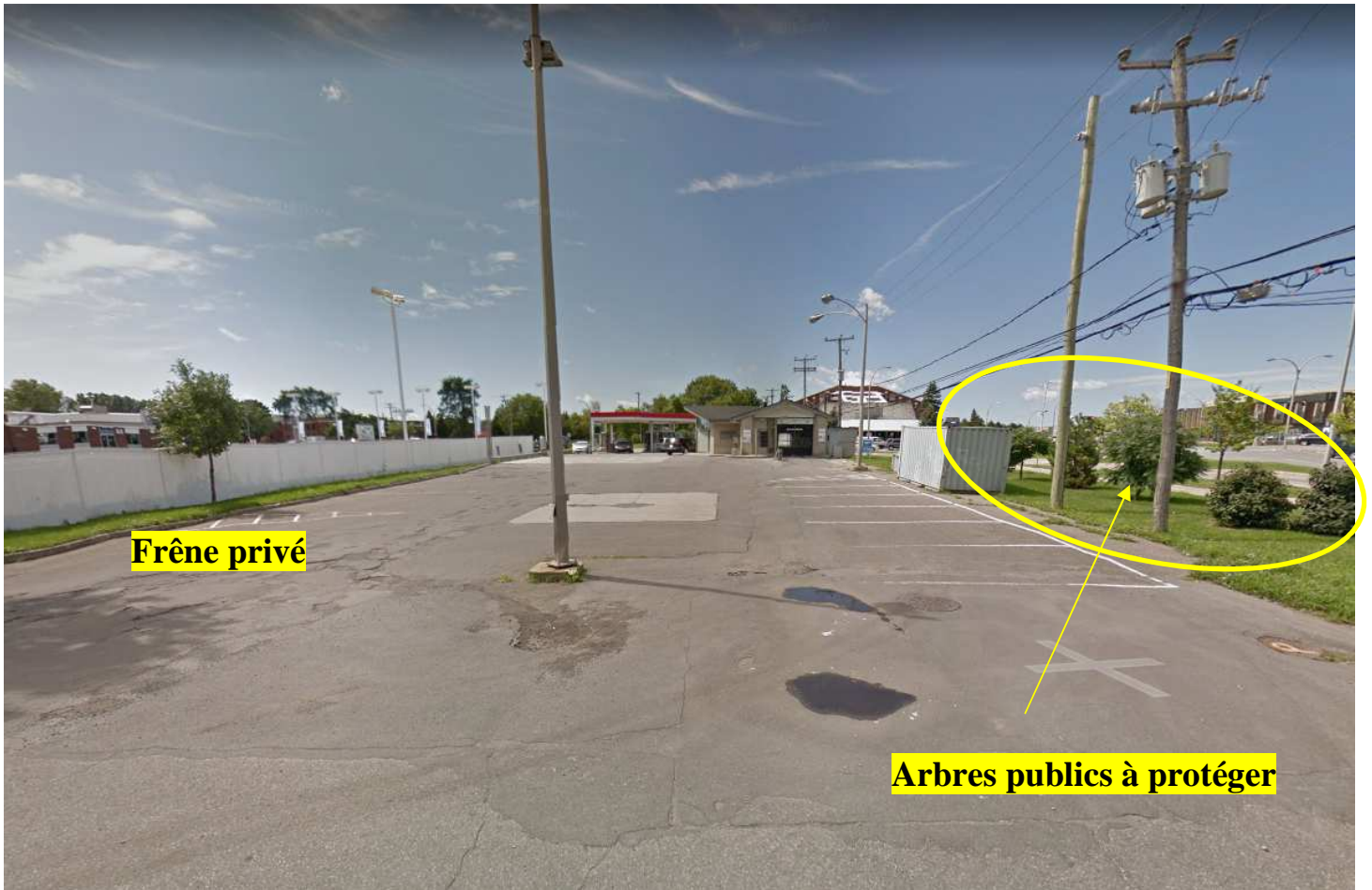
Photo #1 : Condition actuelle du site au niveau de l'avenue Maywood.