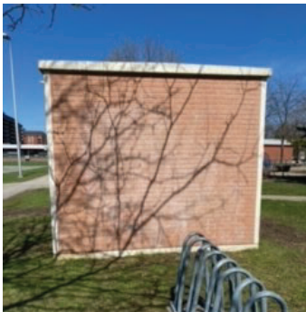
7 pieds de haut par 9 pieds de large (approximatif)