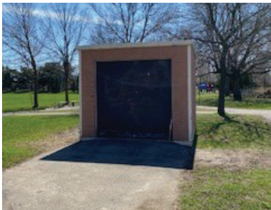
Mur complet : 7 pieds de haut par 9 pieds de large (approximatif) Porte de garage : 6 pieds de haut par 6 pieds de large (approximatif)