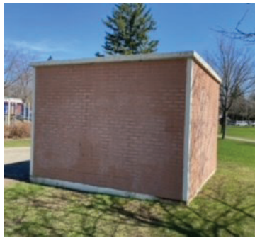
7 pieds de haut par 10 pieds de large (approximatif)