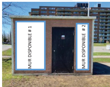
Mur disponible #1 : 7 pieds de haut par 5 pieds de large (approximatif) Mur disponible #2 : 7 pieds de haut par 2 pieds de large (approximatif) Mur complet : 7 pieds de haut par 9 pieds de large (approximatif)